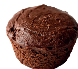
Fondant au chocolat 3 €