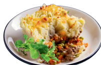
Plat du jour