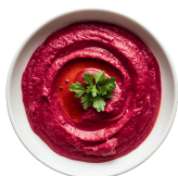
Tartinable de légumes + gressins 4€ / pers.