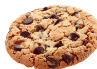
Cookie 3,50 €