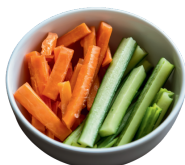
Bol de légumes crus + mayonnaise 2€ / pers.