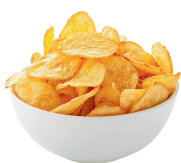
Bol de chips 2€ / pers.