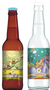
Bière sans alcool ou limonade 4 / pers.