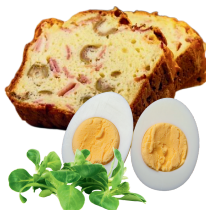
Cake jambon-olives-gruyère + oeuf dur + salade