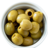
Olives vertes 2€ / pers.