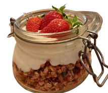
Verrine granola, yaourt et fraises 5 €