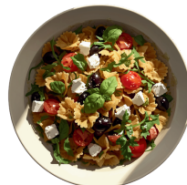
Salade de pâtes